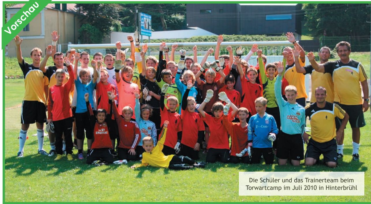
Die Schüler und das Trainerteam beim Torwartcamp im Juli 2010 in Hinterbrühl