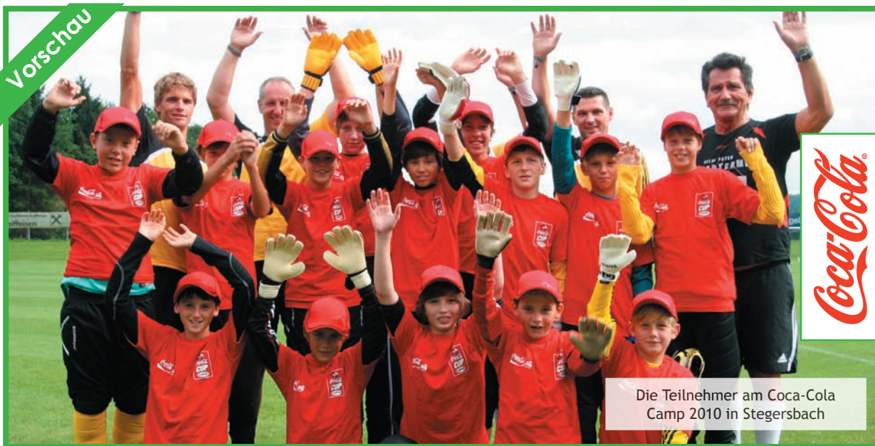
Die Teilnehmer am Coca-Cola Camp 2010 in Stegersbach

Der Youngster über seine Erfahrung beim Meister SK Sturm Graz!