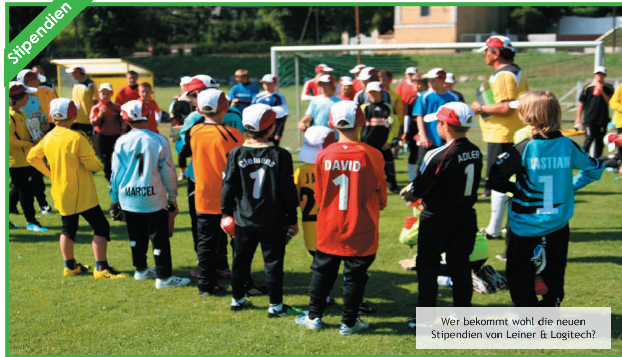
Wer bekommt wohl die neuen Stipendien von Leiner & Logitech?