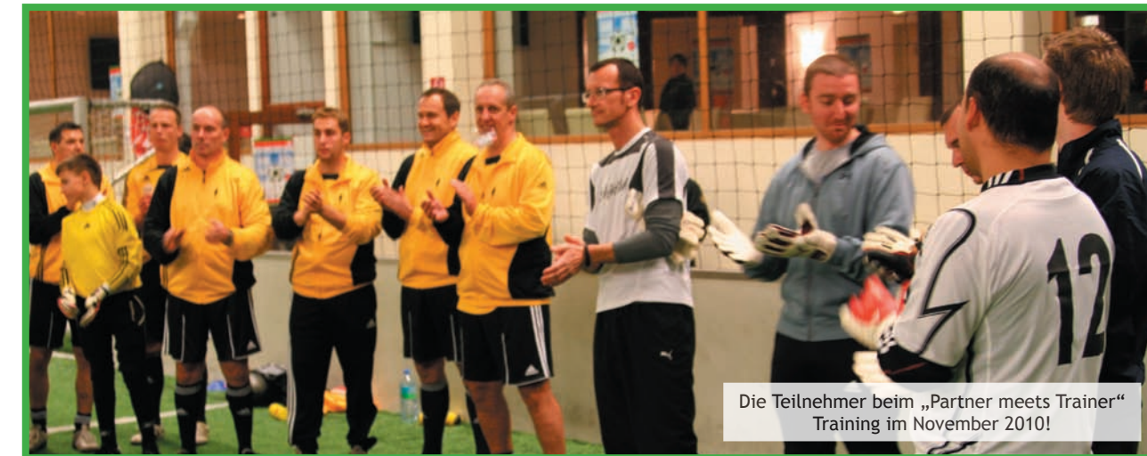
Die Teilnehmer beim „Partner meets Trainer“ Training im November 2010!

Telefon: +43 (0)676 97 29 412 | office@hp-torwertschule.at | www.hp-torwertschule.at