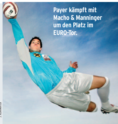
Payer kämpft mit Macho & Manning um den Platz im EURO-Tor.

Unangenehmster Gegenspieler? Roland Linz – auf dem Platz ein ausgekochtes Schlitzohr, als Teamkollege ein guter Kumpel.